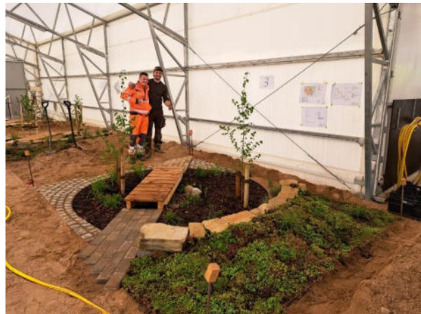
Ergebnis beider Teams der fertiggestellten Baustelle